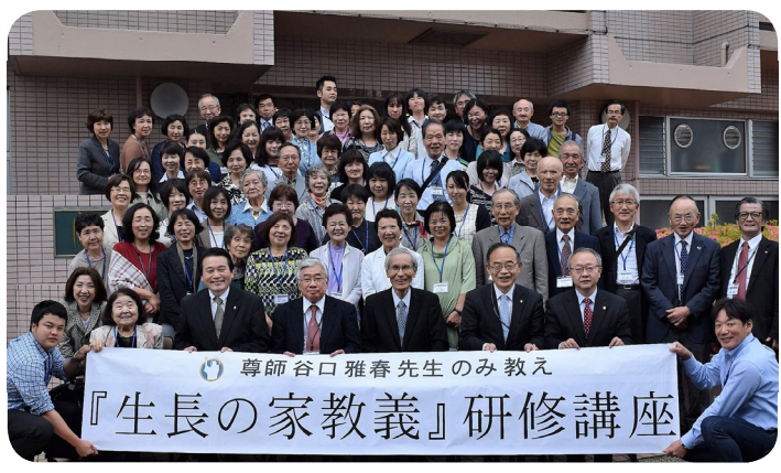
会場となった「リフレフォーラム」の前で