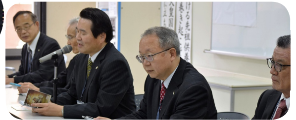
親しく真剣にご指導くださる講師陣