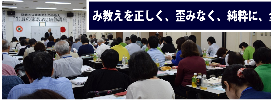
後ろの通路まで埋め尽くし、熱気あふれる会場