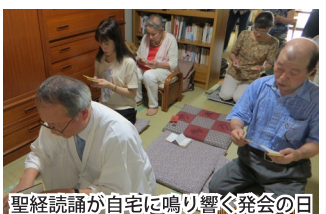
聖經読誦が自宅に鳴り響く発会の日

そして、先日は第2回目の誌友会でした。参加した4名の体験発表になり、皆さん、平気なお顔していますが、大変な人生の荒波をこのみ教えで乗り越えてこられたんだなあと感動しました。誌友会を開くようになって、伝えたい思いが一層強くなりました。