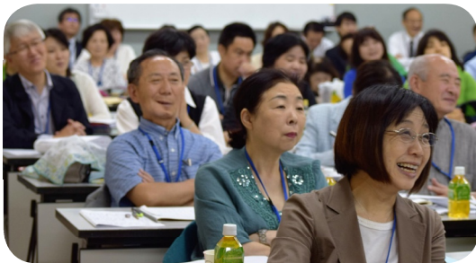
和やかに進む全参加者の研修