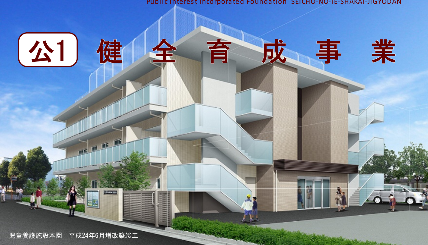
児童養護施設本園 平成24年6月増改築竣工