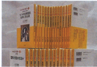
新編全 65 巻 現在第 32 巻まで刊行！