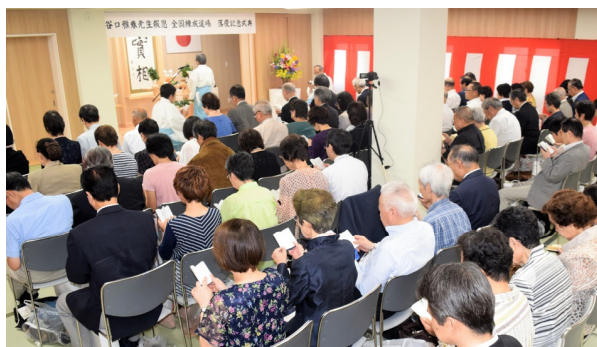
厳粛で清らかな空気につつまれた「落慶捧堂祭」