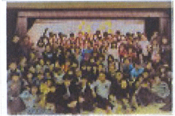
谷口雅春先生の慈愛のお心を受け継いで！