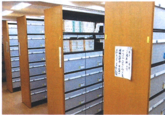
聖典を全て閲覧できる (東京都国立市)