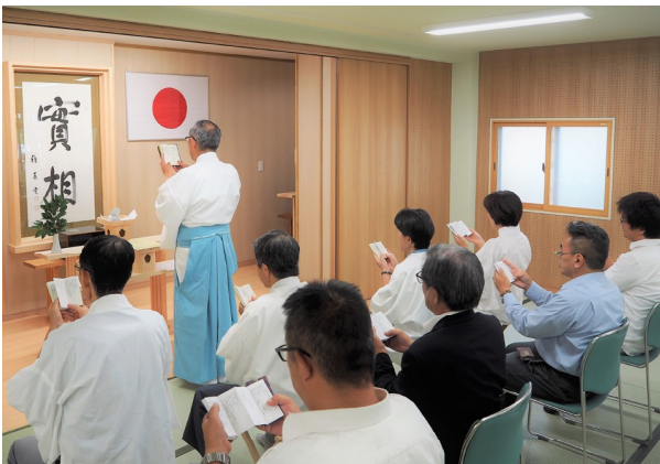
お一人お一人の「実相円満誦行」を行い、丁寧に真心の聖經供養をさせていただきます。

このたび落慶した谷口雅春先生報恩全国練成道場の拜殿において、10月1日より毎朝9時から10時15分まで「神癒・聖經供養」が始まります。