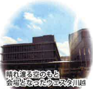
晴れ渡る空のもと 会場となったウエスタ川越