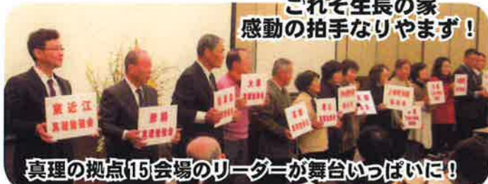
真理の拠点15会場のリーダーが舞台いっぱい!

谷口雅春先生の実相哲学がここに! 谷口雅春先生の実相哲学を忠実に伝えられている講師のお姿に感動しました。現教団では