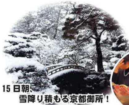
15日朝、雪降り積もる京都御所!