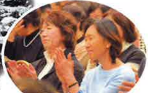
これぞ生長の家 感動の拍手なりやまず!