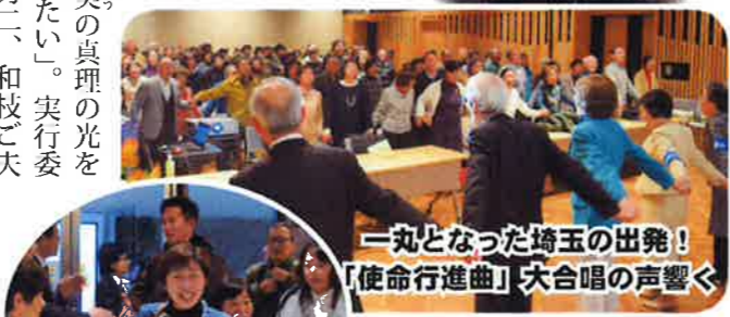
一丸となった埼玉の出発! 「使命行進曲」大合唱の響き