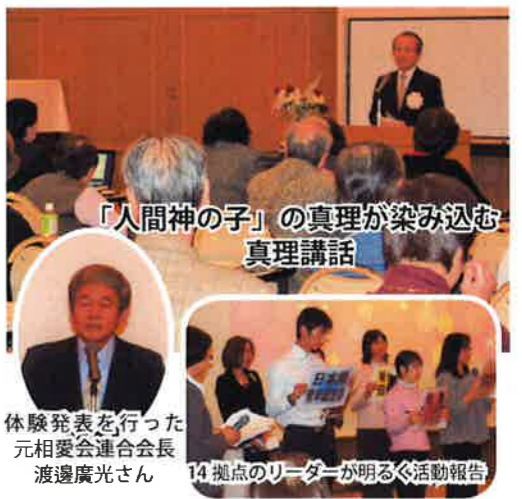
「人間神の子」の真理が染み込む 真理講話