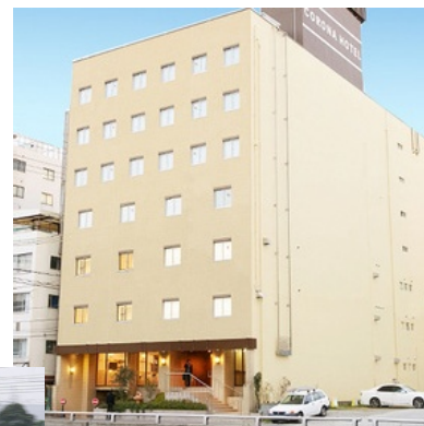
会場となる大阪コロナホテル （研修会場と宿泊一体型） 新幹線を降りて徒歩 3 分