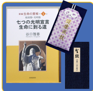
「続々甘露の法雨」のお守り 新編『生命の實相』・聖經『甘露の法雨』 谷口雅春 七つの光明宣言 生命に到る道