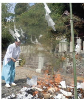
毎年8月、霊牌による「浄化の儀」が丁寧に執り行われる。(大年神社での霊牌焼納の様子)