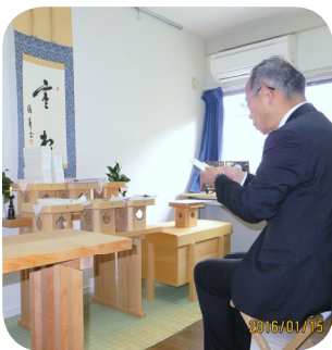
「献資申込書」をご神前に奉安し、毎朝祝福祈願をさせていただきます。