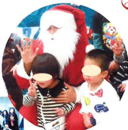
サンタクロースのおひげでピース 総勢 100 名で記念写真