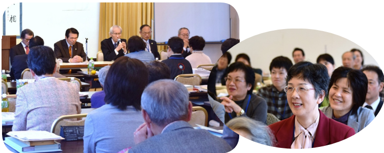
教義に関する具体的な質問や意見が飛び交う全体研修の時間