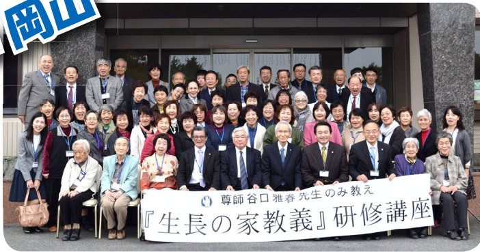
会場となった「くらしき山陽ハイツ」の前で