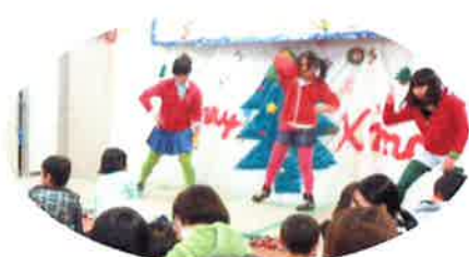
ダンスを披露した女子3人組、 テンポよくイキがピッタリ