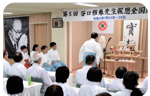
全国練成道場における丁寧な御祭り

生活篇の尊師のお言葉はどの項も力強く、魂をゆさぶられました。自分の地下の水栓を思い切って開いて、行動する後押しをしていただきました。郷里長崎の小さな町の道場に、五十人の高校生仲間を集めることのできた見真会は、自分の無能力と人のまごころと神様を信じて殻を破れた、人生初の自己変革体験でした。 念願の小学校教師となって三十年近