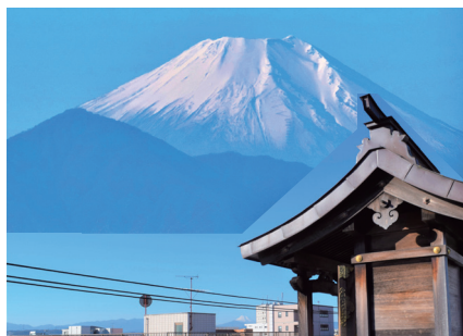
龍宮住吉本宮社殿より霊峰富士山を望む(組写真)

今、現に私達を本当に護り救い給う尊師谷口雅春先生に感謝申し上げますとともに、尊師の愛と願いを受け継ぎ、永遠にそのみ教えを伝えることとお誓いするものです。